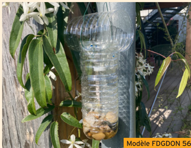
Modèle FDGDON 56

C'est un des premiers enseignements de l'étude de l'ITSAP 7 , avec un piégeage sur plusieurs années consécutives, l'effet sur le nombre de nids est renforcé. La continuité du piégeage augmentera donc son efficacité.