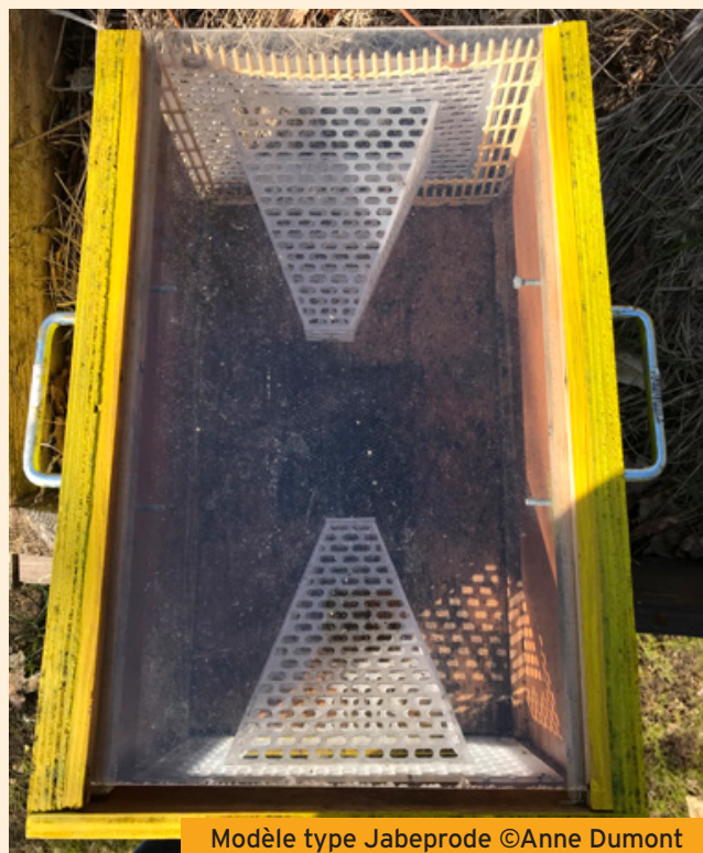
Modèle type Jabeprode ©Anne Dumont